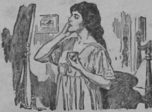
EL UNGUENTO DE DOAN SU FABRICACION Y SUS APLICACIONES

El Unguento de Doan es una preparación hecha con todos los requisitos que la Ciencia y la Ley exigen. En su composición entran solo sustancias de la más alta calidad de pureza y de mayor poder medicinal, cualidades que son previamente comprobadas en nuestros laboratorios.